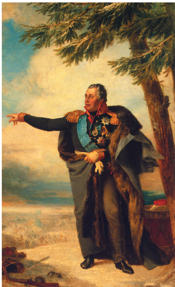
Джордж Доу. Портрет Михаила Илларионовича Кутузова

на данном поприще. И когда переговоры о торговых тарифах и размерах пошлины за проход в проливах с турецким султаном заходят в тупик в 1793 году, Кутузов осмеливается на отчаянный поступок — он проникает в гарем султана. Надо ли говорить, что гарем был тогда личным пространством, и безумцам, оказавшимся там, грозила жестокая расправа в виде четвертования? Однако Кутузов остался цел и невредим, более того, он сумел уладить все спорные моменты.