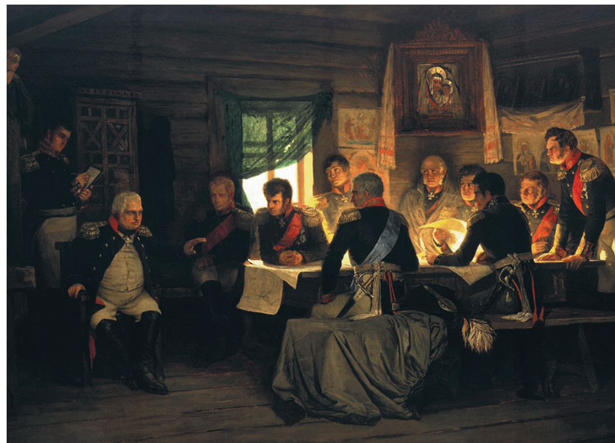
А. Д. Кившенко. Военный совет в Филях

В 1795 году Кутузов был директором Сухопутного шляхетского (1-го кадетского) корпуса, но современникам хорошо известно, что этот пост он получил благодаря стремлению угодить фавориту Екатерины II Платону Зубову. Закаленный в боях 50-летний Кутузов каждое утро варил 27-летнему фавориту кофе по-турецки. За это его называли «хвостом Зубова», а в обществе появилось понятие «кофейник Кутузова» как символ унижения дворянства.