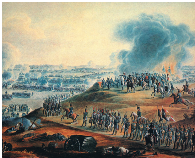
Бородино, акварель неизвестного художника

“ Состояние мое здесь становится мне тяжело, при всем моем терпении. Фельдмаршал делает все по советам других; однако же за всякую неудачу сердится тут же и на меня, так, как бы точно делал по моему совету. Мое положение тем тяжелее, что я должен скрывать все недовольствие мое, не показать никому виду, чтобы не испортить службы; да и тебя прошу никому об этом не говорить и ко мне об этом не писать. Буду терпеть, пока смогу. (Из письма жене. 16 мая 1809. Галац).