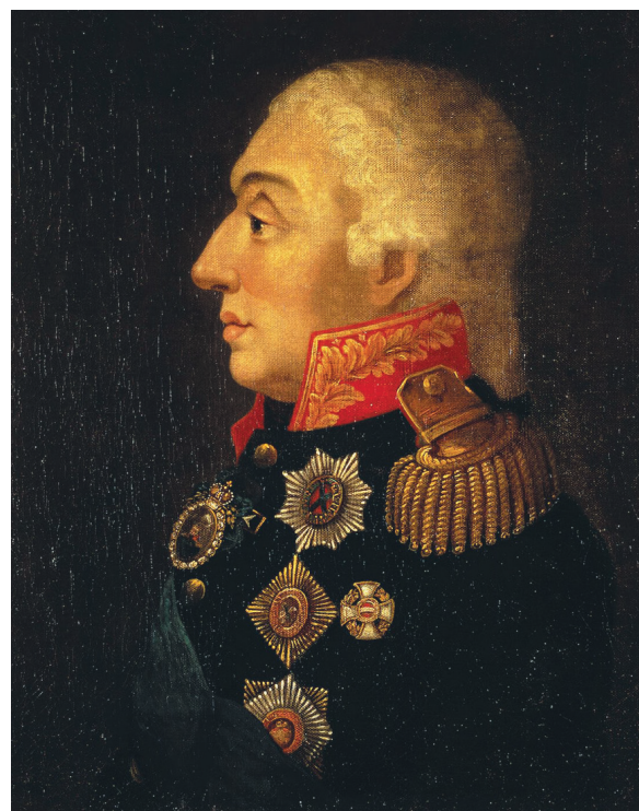
Неизвестный художник. Портрет Фельдмаршала М. И. Кутузова

Его стремление угождать появилось гораздо раньше и даже было описано самим А. С. Пушкиным, который высказывался о самой тенденции дворянского угодничества так: «Мы видели, каким образом Екатерина унизила дух дворянства. В этом деле ревностно помогали ей любимцы. Стоит напомнить <...> об обезьяне графа Зубова, о кофейнике князя Кутузова и проч. и проч.»