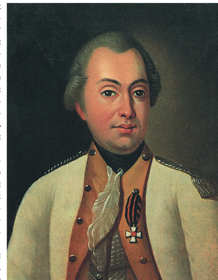
Неизвестный художник. Портрет М. И. Кутузова в мундире полковника Луганского пикинерного полка

Эта его особенность позже, во время Русско-Турецкой войны 1768—1774 годов сыграла с ним злую шутку, когда он на одной из пирушек, не выдержав, передразнил главнокомандующего графа П. А. Румян-